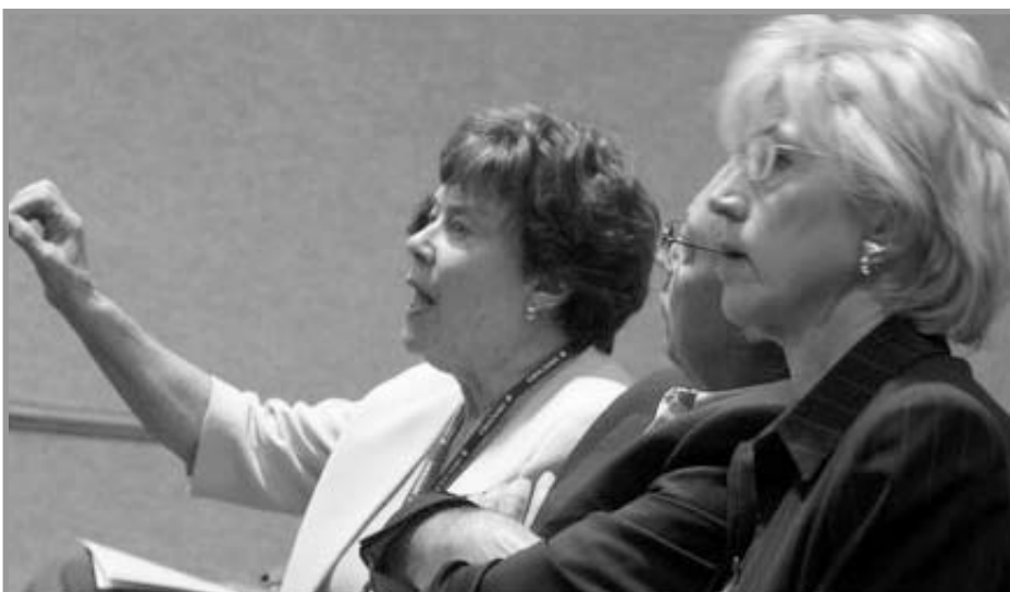
G.-dr. : l'hon. Claire L'Heureux-Dubé, la Très hon. Beverley McLachlin

La réunion a été suivie d'une réception généreusement offerte par le cabinet juridique Fraser Milner Casgrain, au cours de laquelle les membres de la CIJ en provenance de tout le pays ont eu l'occasion de créer et de renouveler des connaissances avec des collègues aux vues similaires. •