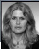
Juge Radmila Dacic