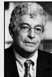
L'hon. Arthur Chaskalson